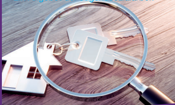
Bild Titel